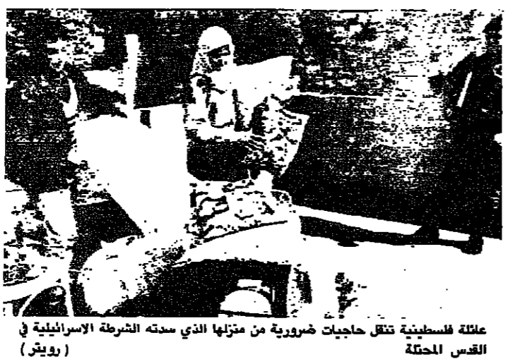
عائلة فلسطينية تنقل حاجيات ضرورية من منزلها الذي ستهته الشرطة الإسرائيلية في القدس المحتلة

أبو شريف أشاد بموقفها من الانتهاكات أبوابها: الحوار مع واشنطن يستأنف خلال الأيام المقبلة